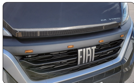
フロントグリルマーカ (4個セット)