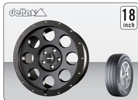
DELTA 4x4 KLASSIK B MATT BLACK (18インチ) ※タイヤ&ホイールセット