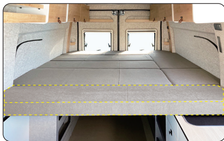
DUCATO CAMPER専用 リヤベッド延長マット

キャンピングカーに装備されているテーブルレールに、ワンタッチで固定可能なドリンクホルダーです。2色のカラーからお選びいただけます。