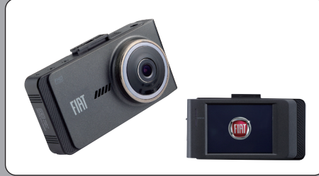
FIAT純正 モニター付ドライブレコーダー

専用設計により、モニター上のタッチパネルにて操作可能。電波状況に応じて、フルセグ、ワンセグを自動的に切り替える デジタルTVチューナー。