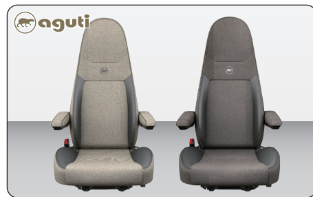
aguti Milan フロントシート (ベージュ/ブラウン) ※1脚

フロントウィンドウと運転席・助手席のサイドウィンドウを覆うプリーツ式(蛇腹式)のブラインドシェード。