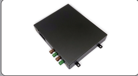
デジタルTVチューナー