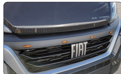
フロントグリルマーカ (4個セット)