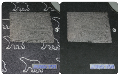
トイファクトリーオリジナル フロアマット(シロクマ/無地)