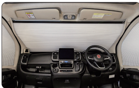
フロントガラスシェード (正面・左右セット)

シロクマロゴデザインとブラック無地の2種類をご用意。両方ともEUROTOYの刺繍ロゴ入り。かかとの擦れを防止するヒールパッド有り。