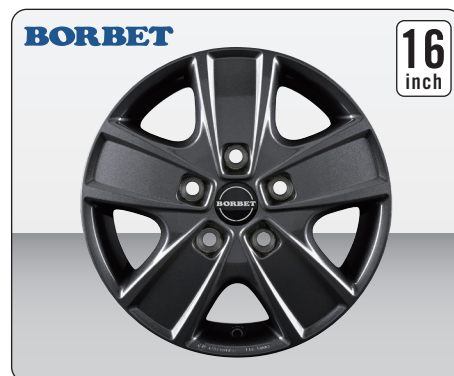
BORBET CWG MISTRAL ANTHRACITE GLOSSY (16インチ)