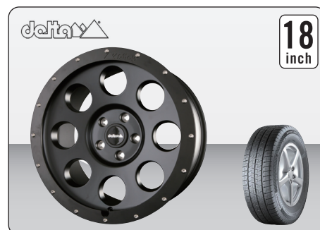
DELTA 4x4 KLASSIK B MATT BLACK (18インチ) ※タイヤ&ホイールセット