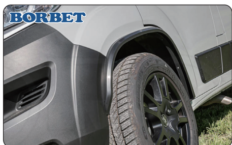
BORBET オーバーフェンダー(小)

FIAT Ducatoスライドドア専用のエントランスライト。スマートなデザインで明るく灯し、夜間の乗り降りも安心です。