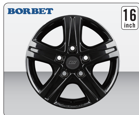
BORBET CWD/LLKW BLACK GLOSSY (16インチ)