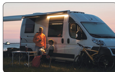
スライドドア エントランスライト

EuroBADEN及びOriginのリヤベッドを延長するための追加マットです。(L1,760mm×W340mm×H100mm)