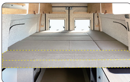
DUCATO CAMPER専用 リヤベッド延長マット

キャンピングカーに装備されているテーブルレールに、ワンタッチで固定可能なドリンクホルダーです。2色のカラーからお選びいただけます。