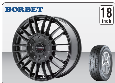
BORBET CW3 MISTRAL ANTHRACITE GLOSSY (18インチ) ※タイヤ&ホイールセット