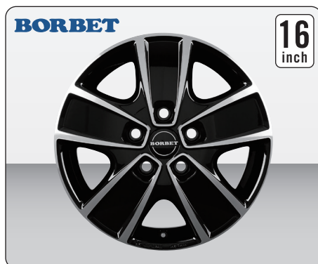
BORBET CWG BLACK POLISHED (16インチ)