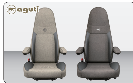
aguti Milan フロントシート (ベージュ/ブラウン) ※ 1脚

フロントウィンドウと運転席・助手席のサイドウィンドウを覆うプリーツ式(蛇腹式)のブラインドシェード。