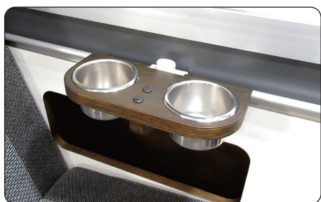
レールカップホルダー (ミディアムブラウン/ナチュラルホワイト)

aguti(アグチ)は、ヨーロッパ高級キャンピングカーに広く選ばれる欧州No.1のRVシートメーカー。長距離運転時の快適性、安全性に優れています。(トイファクトリーはagutiの日本総代理店です)