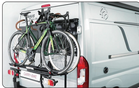
FIAMMA CARRY-BIKE DJ

FIAT Ducato用のオーバーフェンダー。幅が小さいシンプルなタイプです。(4輪セット) ※マッドフラップとの併用取付不可。