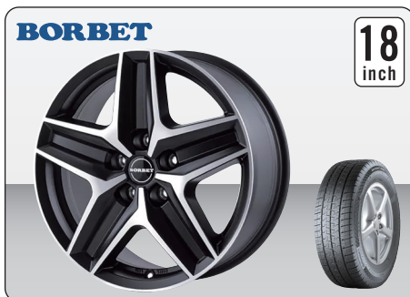
BORBET CWZ BLACK POLISHED MATT (18インチ) ※タイヤ&ホイールセット