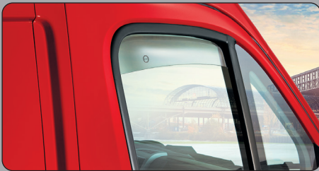
ウインドディフレクター (サイドバイザー)

大切な映像データをクラウドサーバーに保存。レコーダーと「コネクティッドサービス」が一体になり、ドライバーの運転をアシストします。ドライブデータを保存するだけでなく、スマホアプリの「LIVE」ボタンを押せば、いつでもどこでも、リアルタイムに状況の確認が可能。