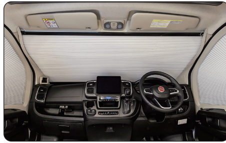
フロントガラスシェード (正面・左右セット)

シロクマロゴデザインとブラック無地の2種類をご用意。両方ともEUROTOYの刺繍ロゴ入り。かかとの擦れを防止するヒールパッド有り。