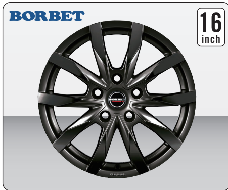
BORBET CW5 MISTRAL ANTHRACITE GLOSSY (16インチ)