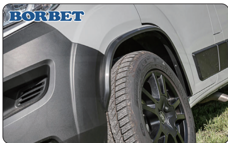
BORBET オーバーフェンダー(小)

FIAT Ducatoスライドドア専用のエントランスライト。スマートなデザインで明るく灯し、夜間の乗り降りも安心です。