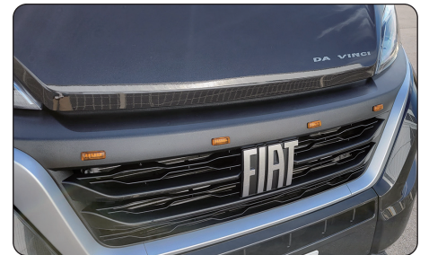
フロントグリルマーカ (4個セット)