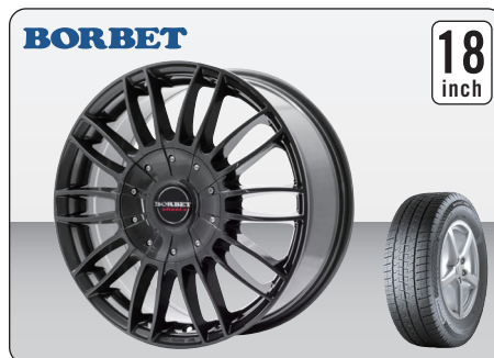
BORBET CW3 MISTRAL ANTHRACITE GLOSSY (18インチ) ※タイヤ&ホイールセット