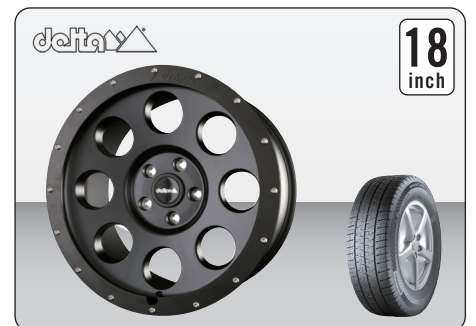
DELTA 4x4 KLASSIK B MATT BLACK (18インチ) ※タイヤ&ホイールセット