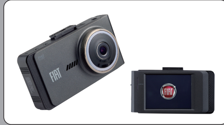
FIAT純正 モニター付ドライブレコーダー

専用設計により、モニター上のタッチパネルにて操作可能。電波状況に応じて、フルセグ、ワンセグを自動的に切り替える デジタルTVチューナー。