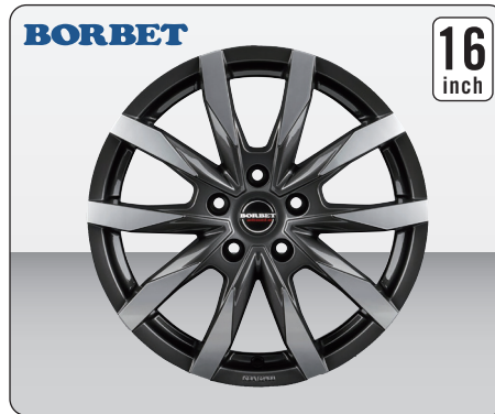
BORBET CW5 MISTRAL ANTHRACITE POLISHED GLOSSY(16インチ)