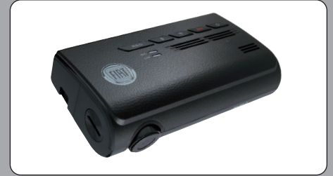
FIAT純正 クラウド型ドライブレコーダー

タッチパネルを操作するだけで、映像の確認や設定が簡単におこなえるモニター付きドライブレコーダー。危険を事前に察知して、警告音とモニター表示で視覚的に危険をお知らせする先進のドライバーアシスト機能搭載。