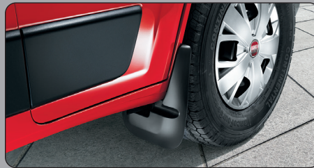
マッドフラップ (フロント)