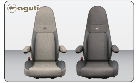
aguti Milan フロントシート (ベージュ/ブラウン) ※ 1脚

フロントウィンドウと運転席・助手席のサイドウィンドウを覆うプリーツ式(蛇腹式)のブラインドシェード。