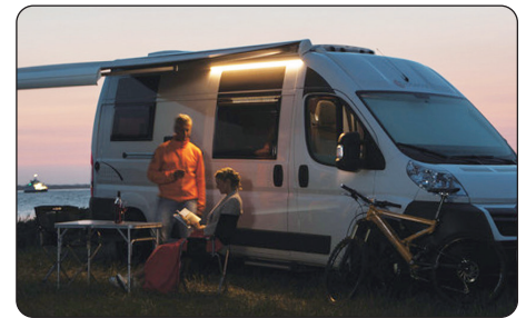
スライドドア エントランスライト

EuroBADEN及びOriginのリヤベッドを延長するための追加マットです。 (L1,760mm×W340mm×H100mm)