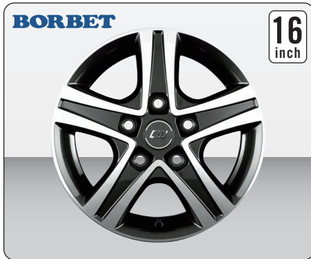
BORBET CWD/LLKW MISTRAL ANTHRACITE POLISHED GLOSSY(16インチ)