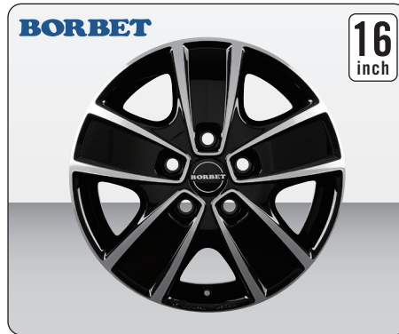
BORBET CWG BLACK POLISHED (16インチ)