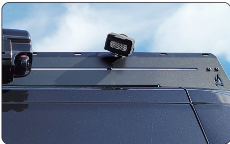
ワーキングランプ