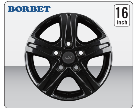
BORBET CWD/LLKW BLACK GLOSSY (16インチ)