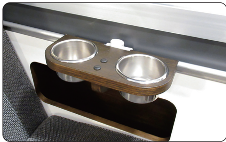
レールカップホルダー (ミディアムブラウン/ナチュラルホワイト)

aguti(アグチ)は、ヨーロッパ高級キャンピングカーに広く選ばれる欧州No.1のRVシートメーカー。長距離運転時の快適性、安全性に優れています。(トイファクトリーはagutiの日本総代理店です)