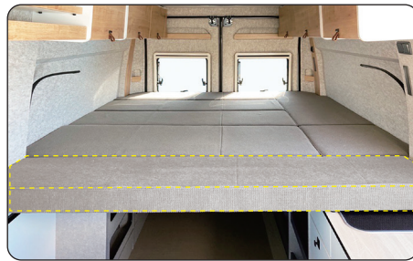
DUCATO CAMPER専用 リヤベッド延長マット

キャンピングカーに装備されているテーブルレールに、ワンタッチで固定可能なドリンクホルダーです。2色のカラーからお選びいただけます。