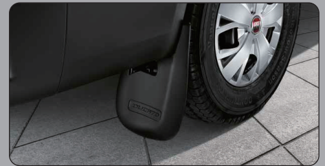
マッドフラップ (リヤ)

タイヤが跳ね上げる砂利などからボディを守り、泥汚れの防止にも効果的です。(左右セット) ※オーバーフェンダーとの併用取付不可