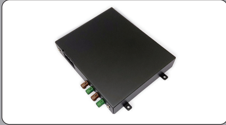
デジタルTVチューナー