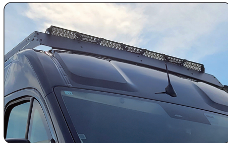
フロント用LEDライトバー (ワイヤレススイッチ付)