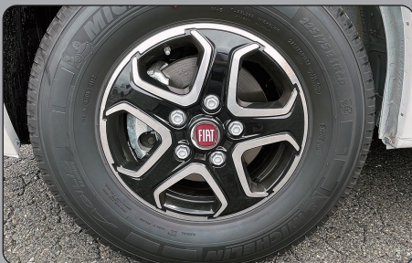
FIAT純正 アルミホイール (16インチ) ※センターキャップ付

タイヤが跳ね上げる砂利などからボディを守り、泥汚れの防止にも効果的です。(左右セット) ※オーバーフェンダーとの併用取付不可