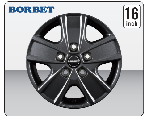
BORBET CWG MISTRAL ANTHRACITE GLOSSY (16インチ)